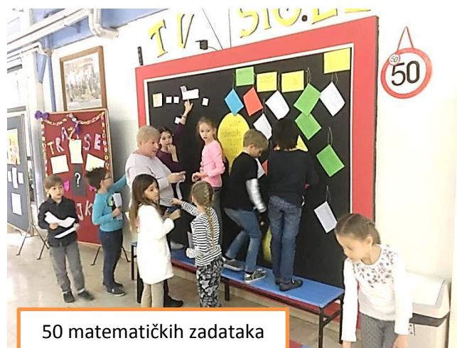
50 matematičkih zadataka

7. prosinca u našoj je školi održana Večer matematike. Sudjelovali su učenici od 1. do 8. razreda, neki roditelji i djelatnici škole. Sudjelovalo je 149 učenika, 108 roditelja i 34 učitelja i profesora. Bilo je veselo, bučno i puno zabave uz ne preteške, ali zanimljive matematičke igre i zadatke.